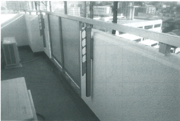
ベランダ手すり壁修正

県福管連は、会員限定の大規模修繕工事に対する「アドバイザー業務」（有料）支援があり、既に100棟以上の施工実績があります。工事等に関し、「素人でわからない」「無駄な出費を抑えたい」「修繕積立金がこれだけしかない」「施工会社はどこを選べば」等という不安をお持ちの会員の皆様、大規模修繕工事に関するご質問は県福管連にご連絡下さい。ご説明させていただきます。